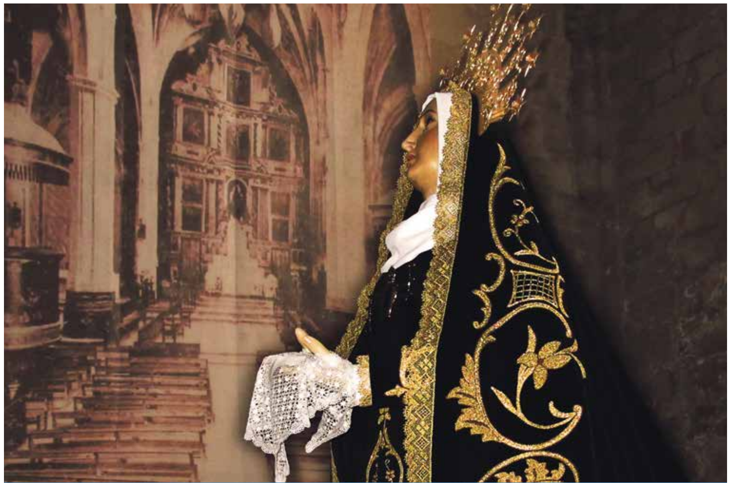
Actualmente son 59 las cofradías de Aragón bajo la advocación de la Virgen en su dolor.