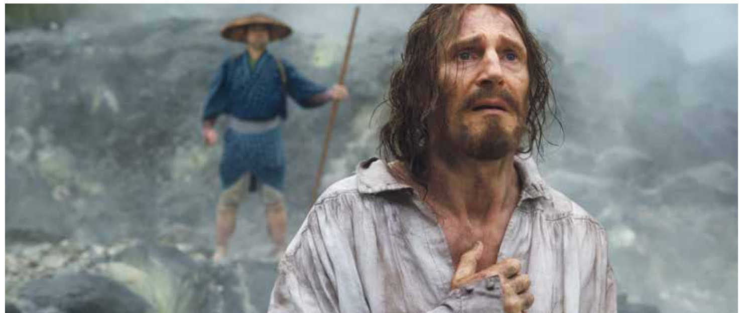
El dilema que plantea 'Silencio' es terrible: ¿salvar vidas, negando la fe?

La segunda es que este artículo no es una crítica de cine, sino un poner las cartas sobre la mesa para que cada quien, con su conciencia bien formada, pueda emitir su juicio y obrar en consecuencia.